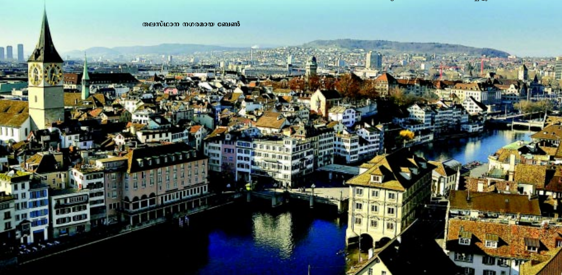
തലസ്ഥാന നഗരമായ ബേൺ

ലോകത്തിലെ ഏറ്റവും വലിയ ഭക്ഷ്യ-പാനീയ നിർമ്മാണ കമ്പനിയാണ് നെസ്തലെ (Nestle). സ്വിറ്റ്സർലൻഡിലെ വെവെയിൽ 1866-ൽ ഹെൻറി നെസ്തലെ എന്ന വ്യവസായി ആരംഭിച്ച ഈ കമ്പനിക്ക് ഇന്ന് ലോകത്തിലെ മിക്ക രാജ്യങ്ങളിലും ഫാക്ടറികളും കോർപ്പറേറ്റ് ഓഫീസുകളുമുണ്ട്. രണ്ടരലക്ഷത്തിലധികംപേർക്ക് കമ്പനി നേരിട്ട് ജോലിക്കൊടുക്കുന്നു. ബേബിഫുഡ്, പാൽ ഉൽപ്പന്നങ്ങൾ, ചോക്കലേറ്റ്, കുപ്പിവെള്ളം, നൂറുകണക്കിന് ബ്രാൻഡുകളിൽ കാപ്പിപോലുള്ള ബിവറേജുകൾ എന്നിവയാണ് പ്രധാന ഉൽപ്പന്നങ്ങൾ. 100 ബില്യൺ കോടി ഡോളറിയധികമാണ് വാർഷിക വിറ്റുവരവ്. മുലപ്പാലിനു പകരമെന്നവണ്ണം മൂന്നാം ലോക രാഷ്ട്രങ്ങളിൽ നെസ്തലെ ബേബിഫുഡ് വിറ്റുതും വമ്പൻ പരസ്യപ്രചാരണം നടത്തിയതും വിവാദമായിരുന്നു. ചില ആഫ്രിക്കൻ രാജ്യങ്ങൾ നെസ്തലെ നിരോധിച്ചിട്ടുണ്ട്.