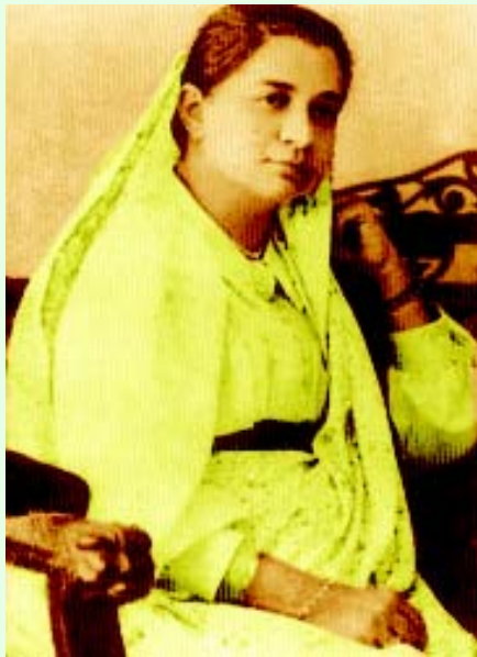
മാഡം ഭിക്കാജി കാമ