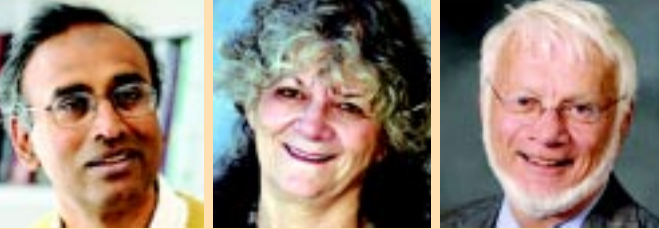
വെങ്കട്ടരാമൻ രാമകൃഷ്ണൻ ആദാ ഇ യോനാത് തോമസ് സ്റ്റീറ്റസ്

ഡി) കണ്ടുപിടിച്ച അമേരിക്കൻ ശാസ്ത്രജ്ഞരായ വില്ലാർഡ് എസ് ബോയിലിനും ജോർജ് ഇൻമിത്തുമാണ് ഫിസിക്സിനുള്ള നോബൽ സമ്മാനം പങ്കിട്ടത്. • സാമ്പശാസ്ത്രത്തിനുള്ള ഈ വർഷത്തെ നോബൽ സമ്മാനത്തിന് ഇന്ത്യൻ യൂണിവേഴ്സിറ്റി, ബ്ലൂമിങ്ഡൺ, യുഎസ്എയിലെ എലിനർ ഓസ്ട്രോമ്യോ (Economic Governace espe-