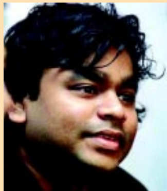
എ ആർ റഹ്മാൻ